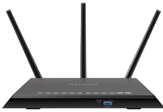
شکل ۲- ابزارهای کنترل والدین ادغام شده با مسیریاب‌های شبکه

برخی از دستگاه‌های کنترل شبکه، برنامه‌هایی را برای نصب روی دستگاه فرزندان ارائه می‌نمایند. این برنامه‌ها در صورت اتصال دستگاه، از طریق سایر منابع ارائه‌دهنده اینترنت (مانند سیم‌کارت یا اینترنت‌های موجود در خارج از خانه)، بالاجبار تمامی ارتباطات دستگاه را از طریق وی پی ان به مسیریاب منزل هدایت می‌نمایند و با این روش کنترل‌های اعمال‌شده در مسیریاب موجود در خانه، به دستگاه فرزند اعمال می‌گردد. Circle Home Plus و Bark Home نمونه‌هایی از ابزارهای کنترل والدین متصل‌شونده به مسیریاب‌ها هستند (وبسایت هوم پلاس ریویو ۵ ، ۲۰۲۲).